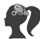
ทรัพย์สินทางปัญญา