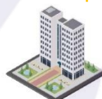
อสังหาริมทรัพย์