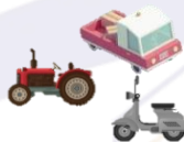
สิ่งทาสินทรัพย์