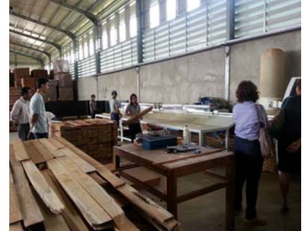
การศึกษาดูงานบริษัท NIBBAN จำกัดและบริษัท National Wood Industry Co.,Ltd ที่ตั้งอยู่ในเขตอุตสาหกรรมอีสต์ดรากร้อน