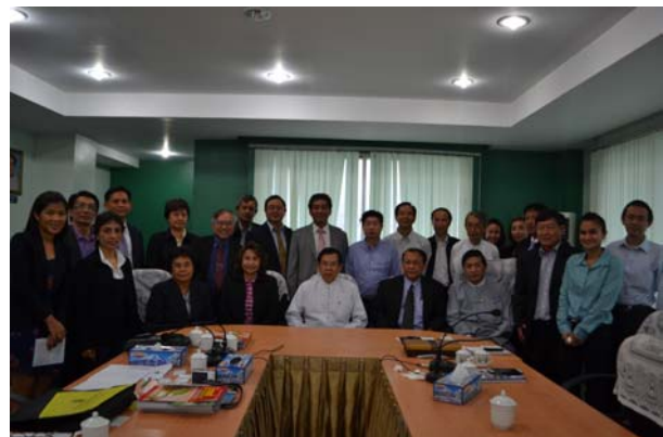
การหารือระหว่างตัวแทนคณะเดินทางจากไทยกับสมาคมอุตสาหกรรมพม่า