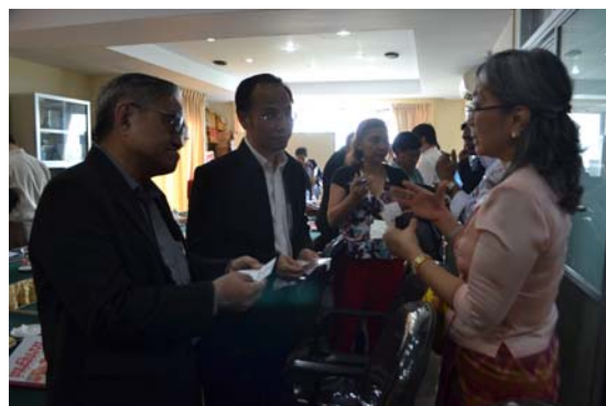
การหารือระหว่างตัวแทนคณะเดินทางจากไทยกับสมาคมผู้ประกอบการเวชภัณฑ์และอุปกรณ์แพทย์พม่า