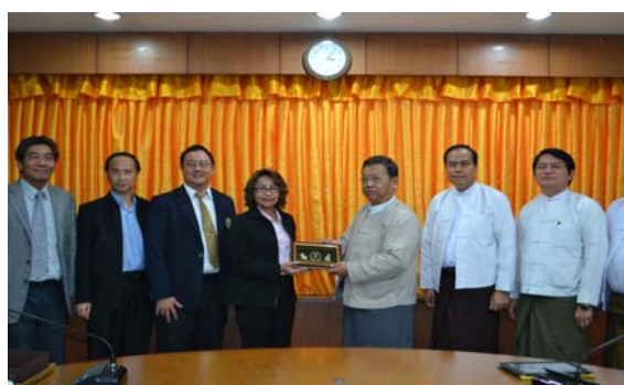
การหารือระหว่างคณะเดินทางจากไทย กับสหพันธ์หอการค้าและอุตสาหกรรมสหภาพเมียนมาร์