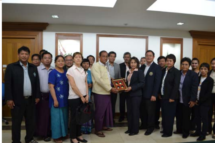
การหารือระหว่างตัวแทนคณะเดินทางจากไทยกับสมาคมผู้ผลิตและส่งออกผักและผลไม้ของพม่า