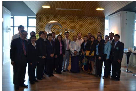
การหารือระหว่างตัวแทนคณะเดินทางจากไทยกับ IMCT และ กลุ่ม Chin Cop