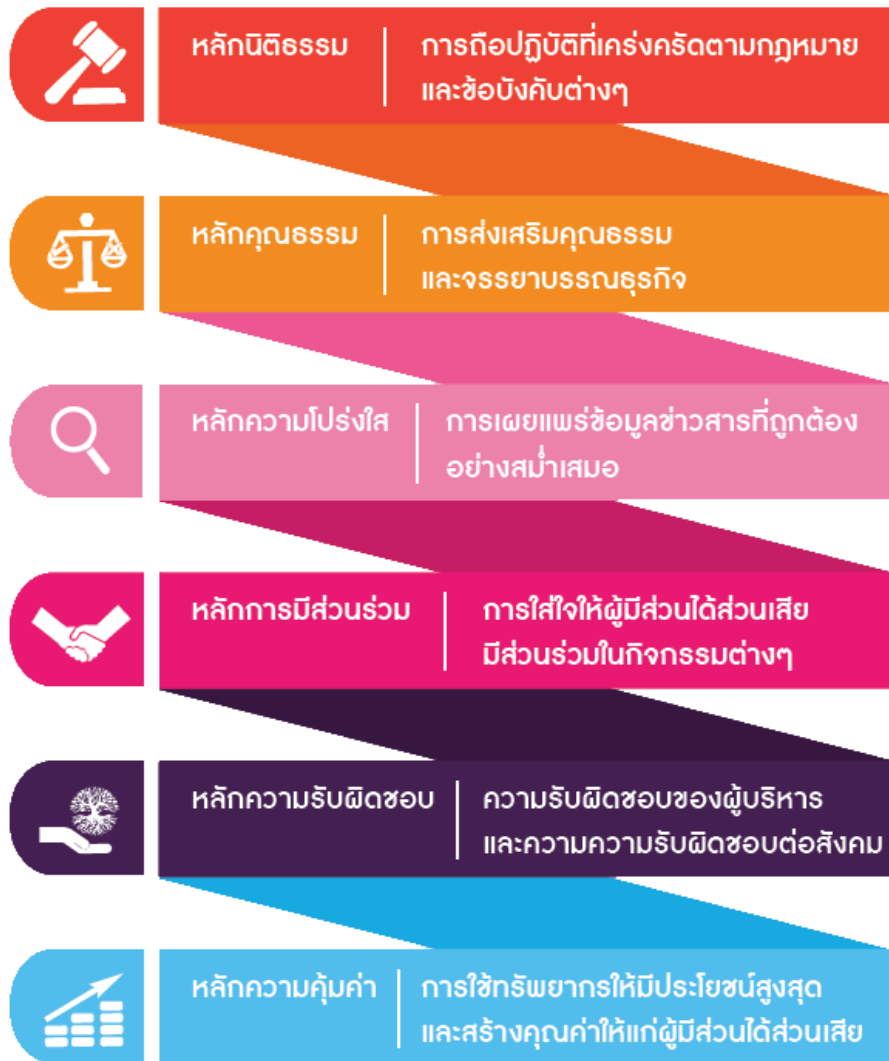
ภาพที่ 2 สาระสำคัญตามหลักเกณฑ์การประเมินมาตรฐานธรรมาภิบาลธุรกิจ