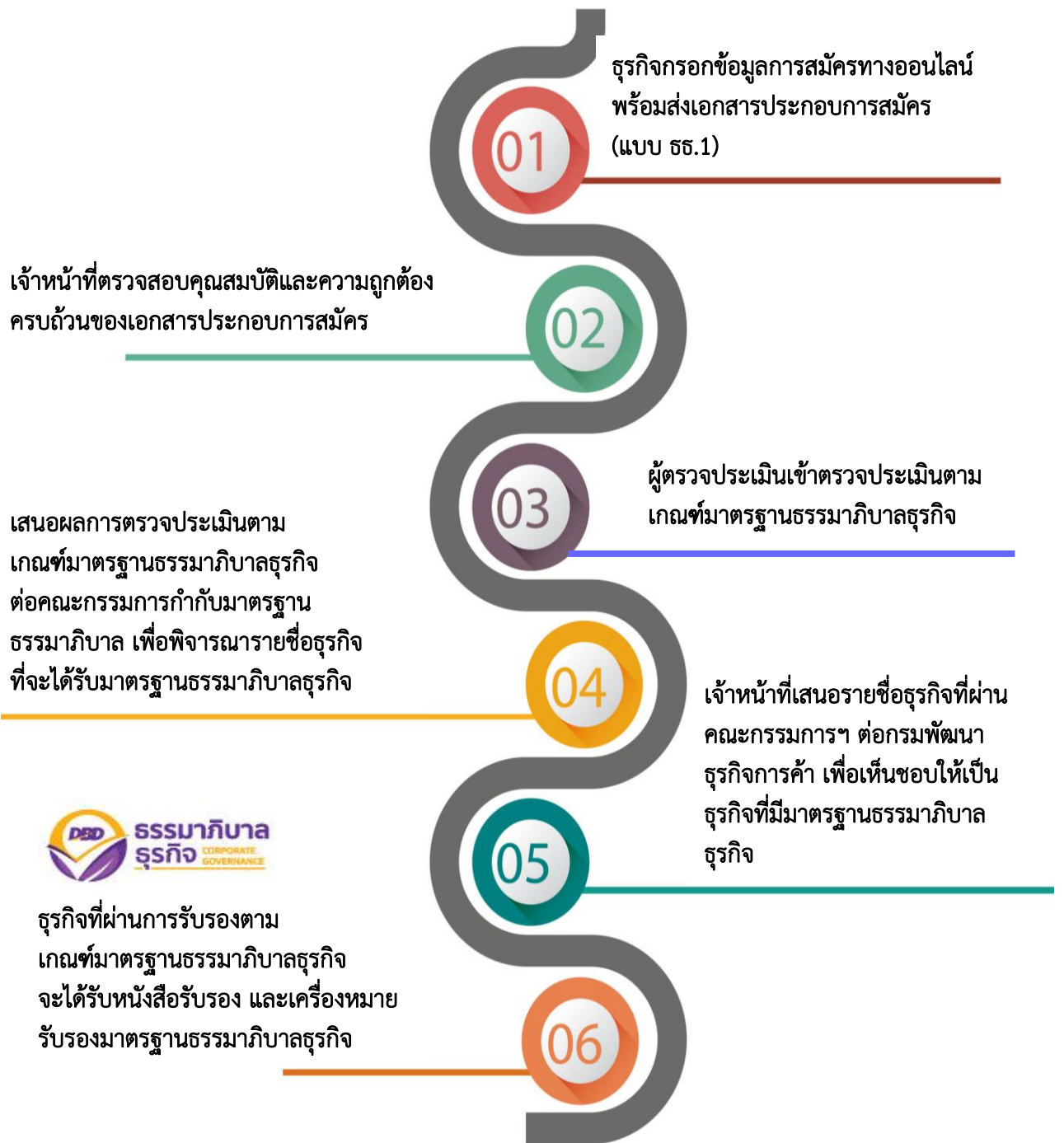
ภาพที่ 3 ภาพแสดงขั้นตอนการปฏิบัติเพื่อการรับรองมาตรฐานธรรมาภิบาลธุรกิจ